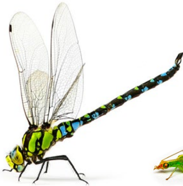
LIBÉLULA Especialista en atacar moscas y mosquitos