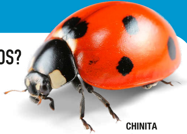
CHINITA Extermina pulgones

Los insectos benéficos son depredadores que, de forma natural controlan plagas.