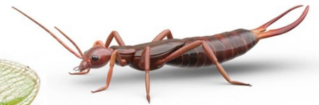
Tijereta Come pulgones y palomillas