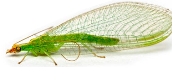
CRISOPA Es el depredador N°1 de la mosca blanca